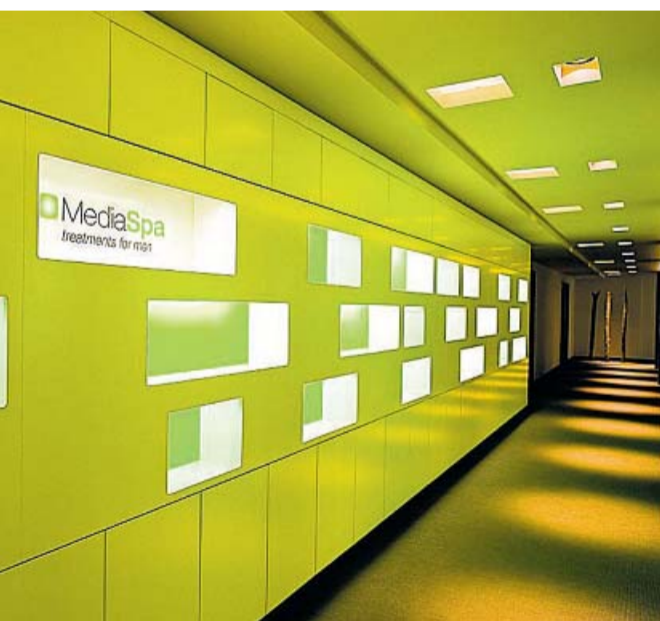
Kühle Farben und klare Linien dominieren im Münchner Media-Spa, dem wohl ersten großen Schönheitssalon, zu dem nur Männer Zutritt haben.

Als männlich gilt: klare Linien, keine Schnörkel. Ganz neu ist der Gedanke nicht. Bereits vor mehr als zehn Jahren kam beispielsweise in den USA eine Pflegeserie auf den Markt, die vor allem durch ihre Klarheit auffiel. Auf den Tuben und Töpfchen stand in einfachen Worten, für